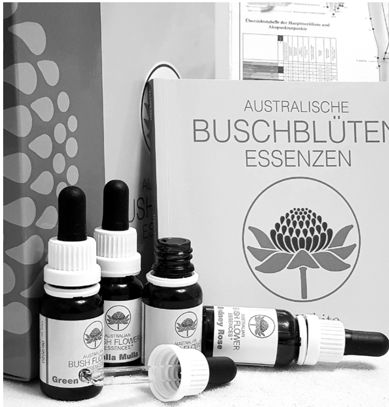
Die Buschblüten sind eines der gängigsten Arbeitsmaterialien des Humanenergetikers. Sie helfen dabei verschiedenste Blockaden, Verspannungen etc. zu lösen.

Liquas explabor aliquo optate perum dolo el ipient alignime id molorum inulpa il eosserum aborerum acium f et il mintus.